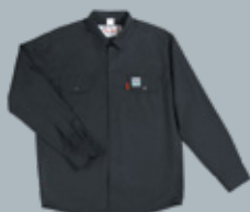
Куртка-рубашка Н/р-1 ЭНЕРГО