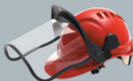
Защитная термостойкая каска со щитком