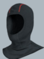
Подшлемник ЭНЕРГО НЛПШ