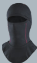
Подшлемник ЭНЕРГО НЗПШ