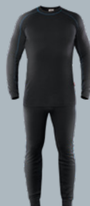
Термостойкое белье Н/6-1